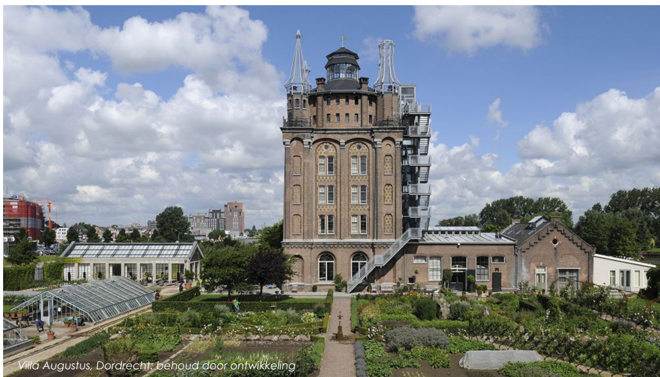
Villa Augustus, Dordrecht: behoud door ontwikkeling

De kracht van het concept van de erfgoedlijnen is dat het inzet op het verbinden van twee schaalniveaus; dat van het object en dat van de lijn. Vanuit de gewenste kwaliteitsimpuls is het dan ook van belang om niet alleen te kijken hoe de afzonderlijke kwaliteiten van de objecten versterkt kunnen worden, maar ook op het niveau van de lijn ambities te formuleren.